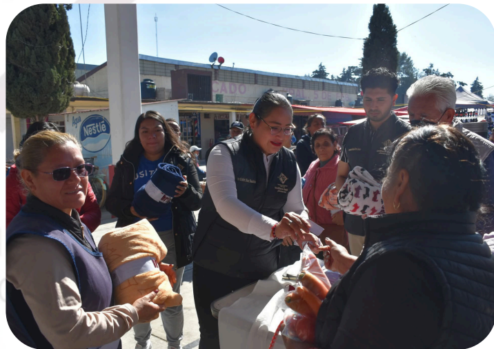
Entrega de cobijas invernales a ciudadanos del Municipio y Comunidades.