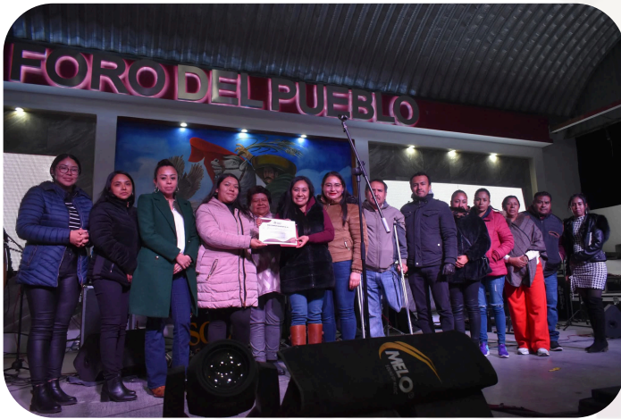
Reconocimiento como Ayuntamiento por participación en la colaboración de la colecta de UBR.