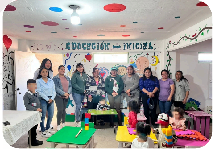
Apoyo en coordinación con nuestra Presidenta Municipal a la Escuelita Inicial de la comunidad de Santa Clara.