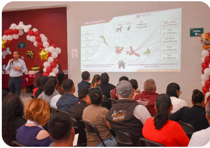
Participación en el foro regional de salud y bienestar animal en tepeapulco