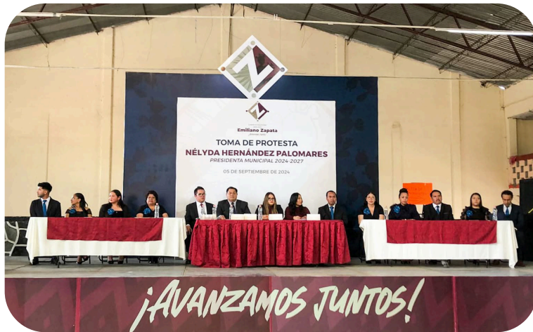
Toma de protesta de nuestra Presidenta Municipal.