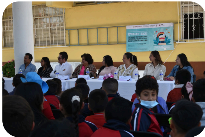
Evento de prevención de la Violencia contra las Mujeres y los Derechos de niñas y niños en la Escuela Primaria Miguel Hidalgo de Emiliano Zapata.