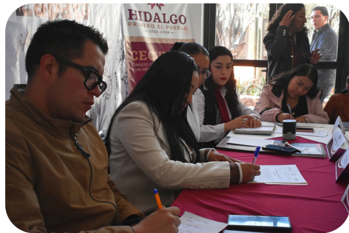
Instalación del comite de salud.