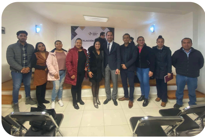
Instalación del comite de Planeación para el Desarrollo Municipal (COPLADEM) de nuestro Municipio.