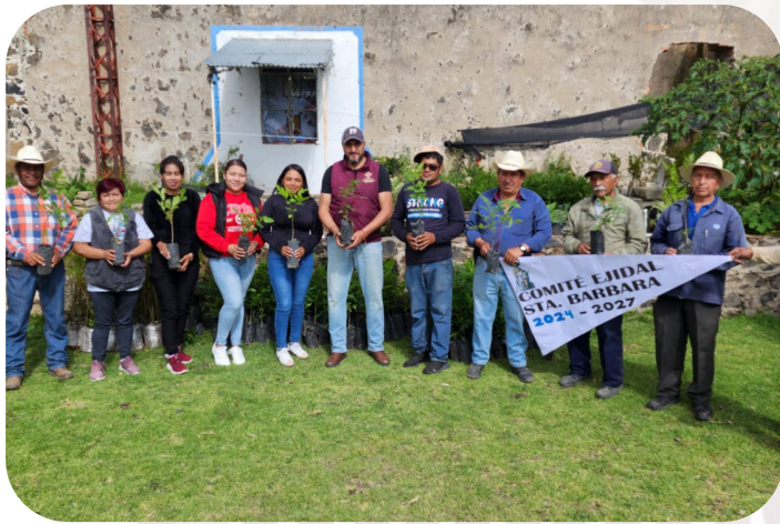
Acompañamiento en conjunto con comités Ejidales y Presencia de Delagados, Dirección de Ecológico junto con el Biberio de Santa Barbara realizaron la donación de árboles.