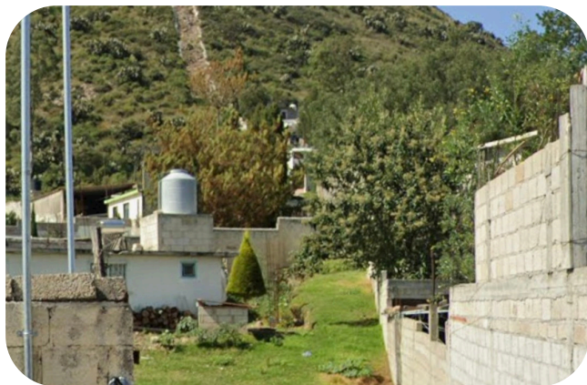
Visita a callejon del preescolar de Santa Clara para tema de deslinde.