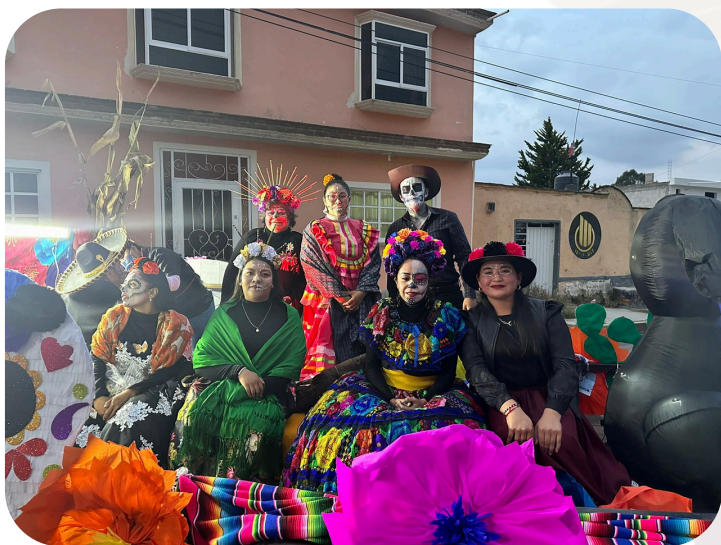
Desfile de día de Muertos recorrido en Comunidades y Municipio.