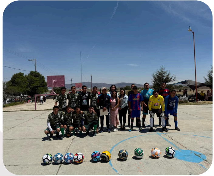
Apoyo para los deportistas de la comunidad en conjunto con Dirección de Deporte