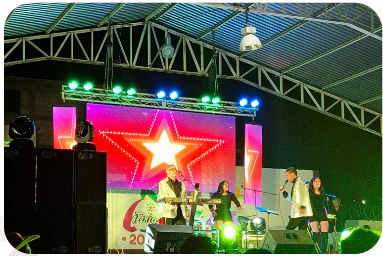
Apoyo para feria patronal en la Comunidad de Santa Clara.