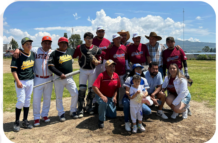
Invitacion a presenciar el partido por parte del Equipo de Béisbol Charros de Santa Clara.