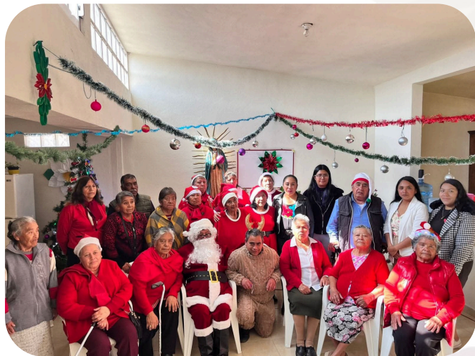
Posada Navideña en la casa del Adulto Mayor en la Comunidad de Santa Clara.