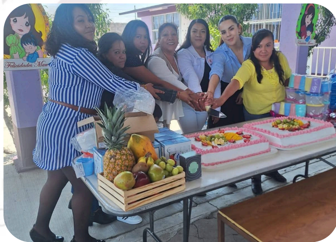
Apoyo en agradecimiento a la invitación al festival del día de las madres en la Escuela Primaria Benito Juárez.