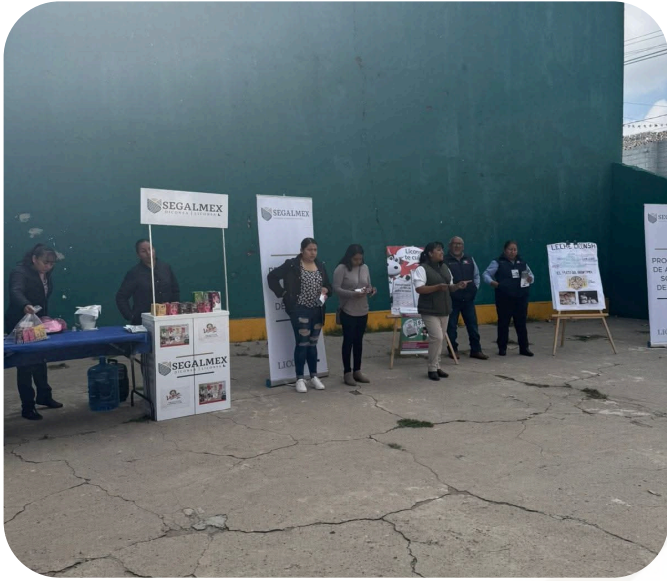
Reunión en conjunto con con promotores de leche liconsa para informar a la comunidad la importancia de su consumo.