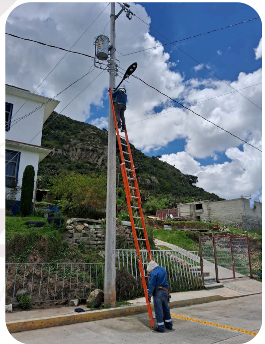
Gestión de alumbrado publico.