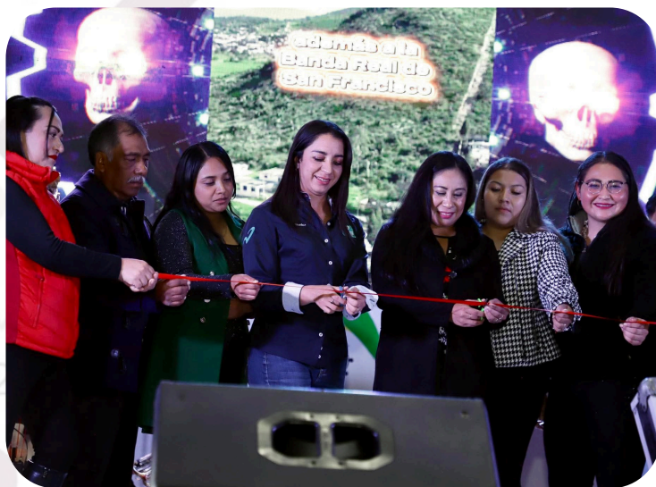
Inauguración de Feria Patronal Santa Clara 2025.