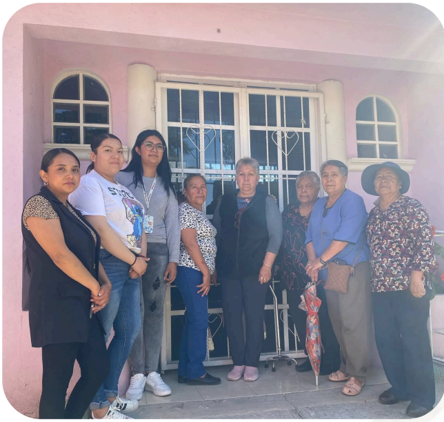
Gestión en conjunto con nuestra Presidenta Municipal se logró colocar la toma de agua de la casa del adulto mayor "Nuevo Despertar".