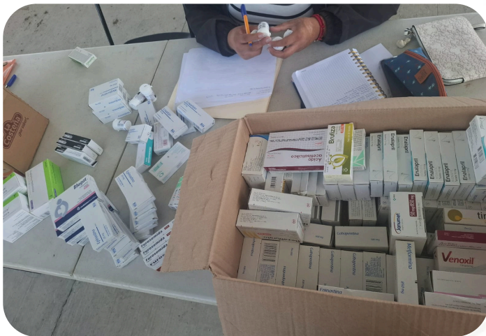
Banco de medicamento en conjunto con la población de Santa Clara , para donación al centro de salud.