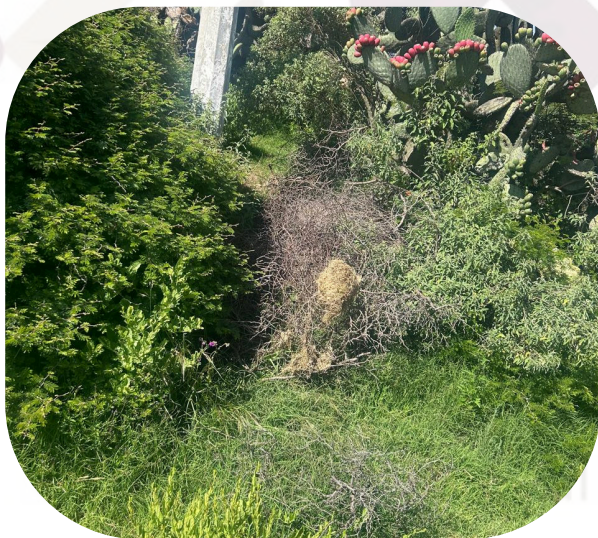
En conjunto con mi comisariada y topografo se realizaron las mediciones para deslindes en diferentes punto.