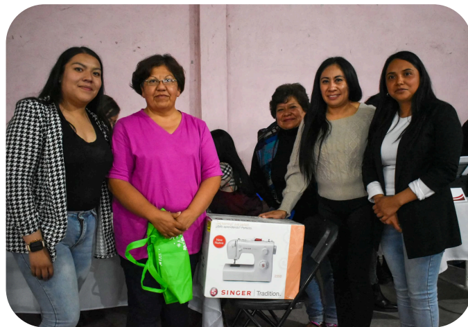
Atendiendo a la ciudadanía en las Rutas del Bienestar.