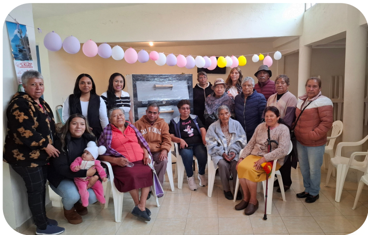
Apoyo en coordinación con nuestra Presidenta Municipal a la casa del adulto mayor de Santa Clara con finalidad de promover distintos cursos.