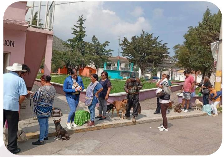
Participación con Jurisdicción sanitaria de apan, dirección de salud, sanidad y control canino y su servidora se realizaron esterilizaciones en la comunidad de Santa Clara.