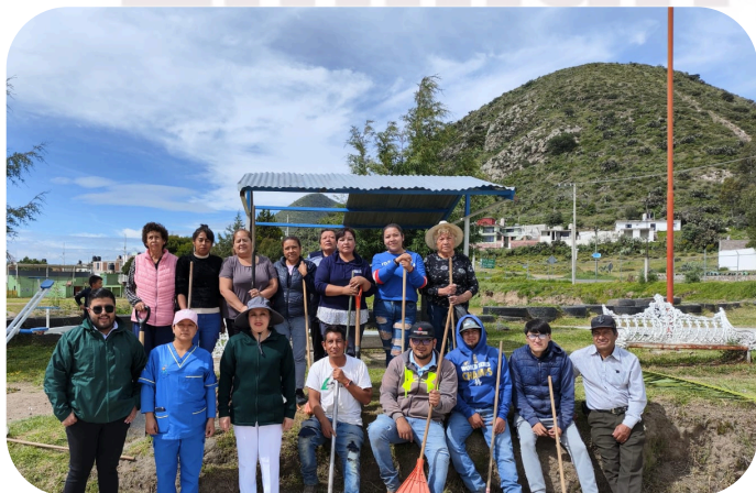
Faena en la unidad deportiva en conjunto con la Clínica IMSS Bienestar de Santa Clara y Delegada.