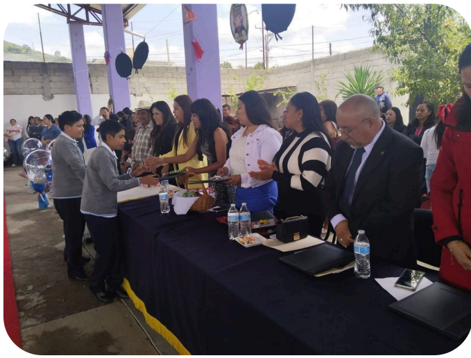
Apoyo en agradecimiento a la invitación a la clausura en la Escuela Primaria Benito Juárez.