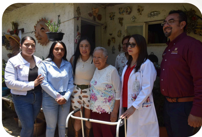
Participación en Entrega de Apoyos Funcionales en la comunidad de Santa Clara, en conjunto con la Presidenta Municipal y la Secretaria de Salud de Hidalgo.