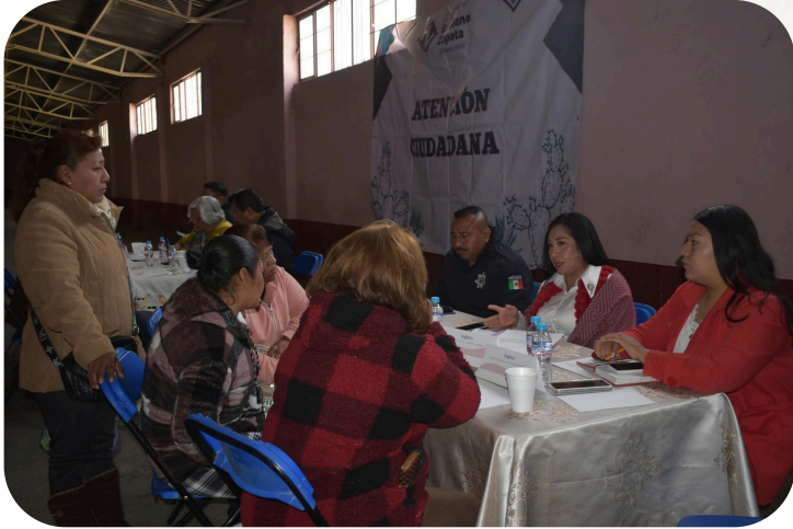
Atención ciudadana en la comunidad de Santa Clara.