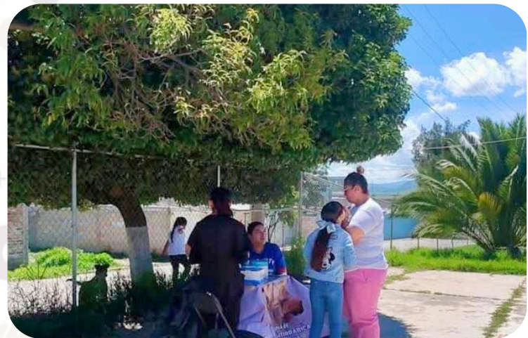
En conjunto con Jurisdicción sanitaria de apan, dirección de salud, sanidad y control canino y su servidora se realizaro campaña de vacunación anti rabica de Santa Clara.