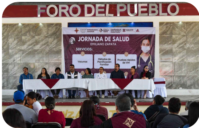
Participación en jornada de salud de nuestro municipio.