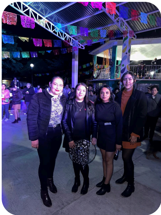
Desfile de Disfraces en la Comunidad de Santa Clara.