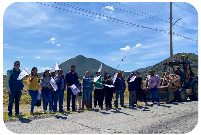
Banderazo de Inicio de Obra de la Ciclo Vía de la Comunidad de Santa Clara.