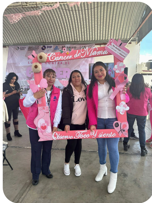
Caminata y evento del Día Mundial Contra el Cáncer De Mamá.