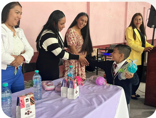
Apoyo en agradecimiento a la invitación a la clausura del preescolar Refinería Hacienda de Loreto.