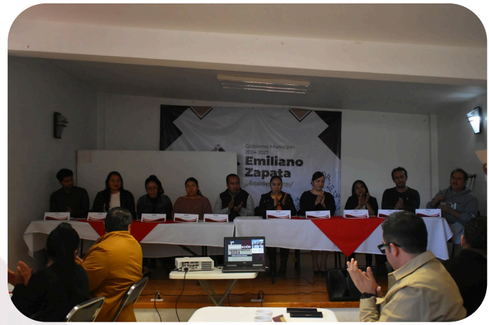
Capacitación a administrativos de Código de Ética y Responsabilidades Administrativas.