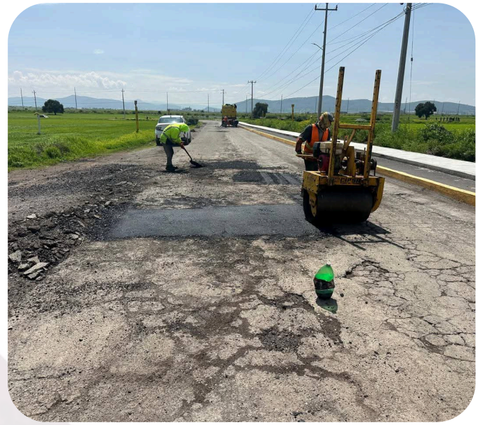
Gestión en conjunto con Dirección de Obras Públicas se realizó el bacheo tramo de Santa Clara a carretera Federal.