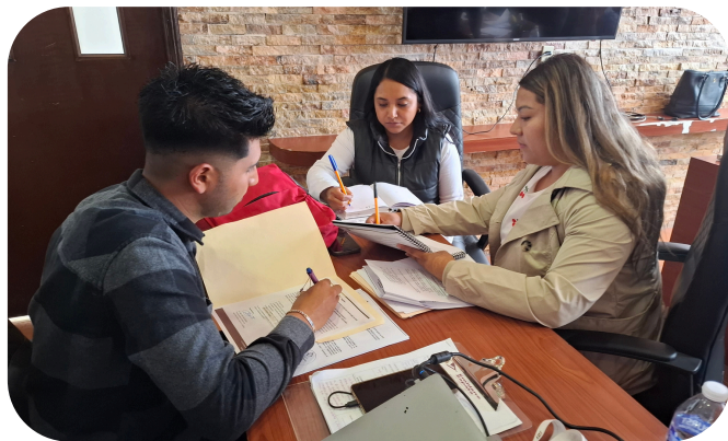
Mesa de trabajo de la comisión.