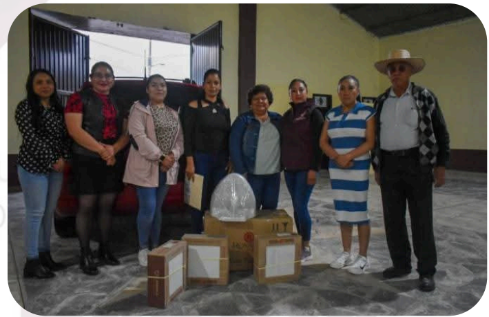
Rutas del Bienestar en José Maria Morelos.