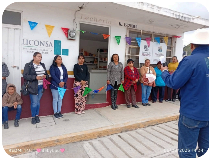
Gestión en conjunto con nuestra Presidenta Municipal tuvimos el gusto de colocar la primera tienda Dicoso en la comunidad de Santa Clara.