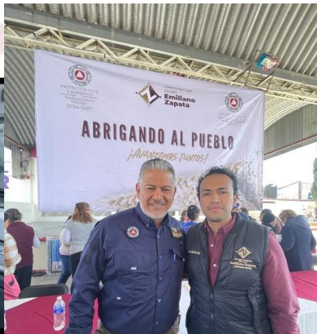
programa "abrigando al pueblo" entrega de cobijas