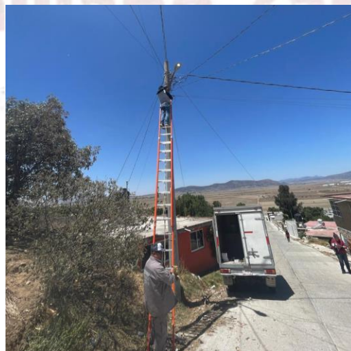
Servicios municipales cambiando luminaria de comunidad