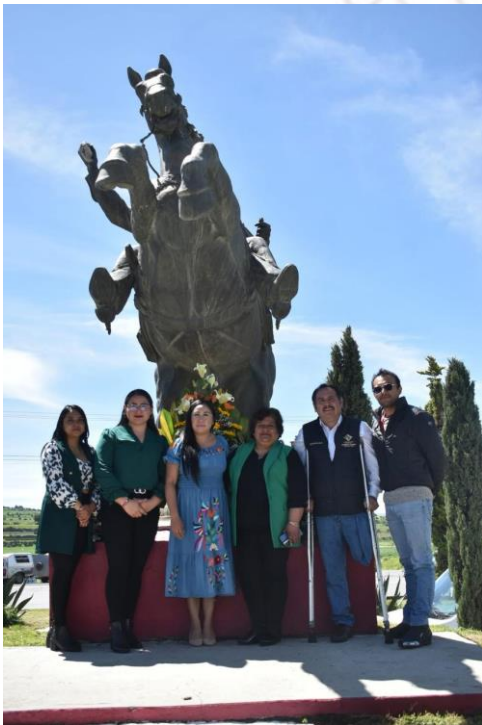
Presidenta y regidores en aniversario E. Zapata

Sin duda alguna la formalidad y asistencia a ceremonias cívicas es no dejar que nuestro legado muera, símbolos de respeto como el natalicio y aniversario de el General Emiliano Zapata son parte de nuestra historia, de igual manera actos oficiales como entrega de patrullas de apoyos sociales de carácter informativo al municipio he sido participe, así como eventos de gran relevancia no solamente se quedan en las sesiones de cabildo, gran parte de poder vigilar y observar los beneficios de los acuerdos pactados se ven a ras de suelo, en los eventos con la población para compartir y convivir en diferentes festividades,