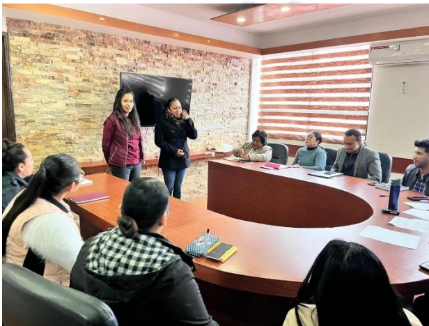
SESIÓN ORDINARIA TOMA PROTESTA DELEGADA COMUNIDAD

Así mismo de manera personal y física he firmado cada una de las actas de todas las sesiones llevadas a cabo en el periodo antes mencionado, haciendo de su conocimiento que he asistido a 24 sesiones ordinarias y 21 sesiones extraordinarias durante este año. De los cuales se desglosan 36 acuerdos en sesión extraordinaria y 81 en sesión ordinaria.