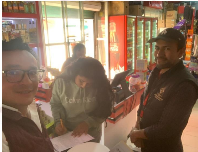
Observando a Director de reglamentos notificando a establecimiento 21-marzo-2025

No solamente a nivel administrativo. también he realizado acompañamientos en las labores de su día a día, como a el área de Reglamentos y espectáculos observando las notificaciones, campañas de regularización para licencias de funcionamiento, la dirección de protección civil acudir a llamados e inspecciones de zonas de riesgo del municipio, instancia de la mujer acercando espacios seguros para terapias en las comunidades participando en clases muestra de defensa personal para mujeres, , observando la entrega de documentación para apoyos y programas de desarrollo agropecuario, participando en actividades recreativas relacionadas al deporte, por mencionar algunos.