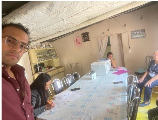
Atención ciudadana apoyo a registro programa calentador solar

Su servidor y amigo ha buscado la manera de hacerles llegar información pronta útil por diferentes medios de comunicación como lo es el perifoneo, mis redes sociales, grupos de Whats App de la comunidad o colonias, dónde también he recibido solicitudes, he compartido información oportuna de programas y beneficios que presidencia municipal emite a la ciudadanía.