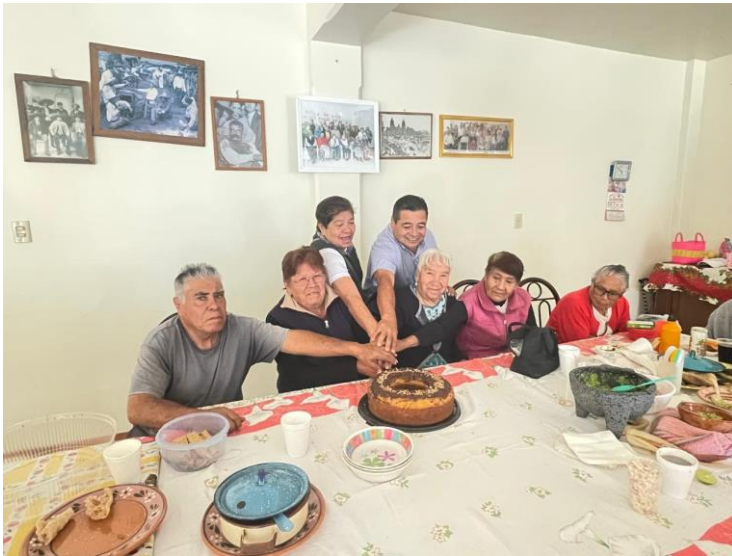
Pastel para casa del adulto mayor, comunidad de José María Morelos

Recordemos que también los adultos mayores son un sector importante en nuestro municipio es por ello que a todas las casas del adulto mayor se les ha hecho mes con mes la donación de un pastel para el festejo con motivo de cumpleaños, así como la convivencia con nuestros adultos mayores.