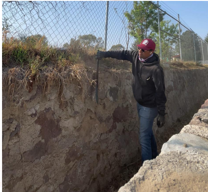
Faena de limpieza regidor en comunidad.

públicos, oficinas, calles, promover campañas de salud, de visión, de esterilización, gestión de bastones sillas., etc, acompañamientos con los directores directoras coordinadores, mesas de trabajo, acercamiento ciudadano, parten de muchos objetivos planteados, claro hay algunos que son a largo plazo y en mi próximo informe me dará gusto decir que siguen los beneficios, las campañas, los apoyos, las actividades que promuevan el bien común de nuestro municipio.