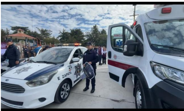
Adquisición parque vehicular