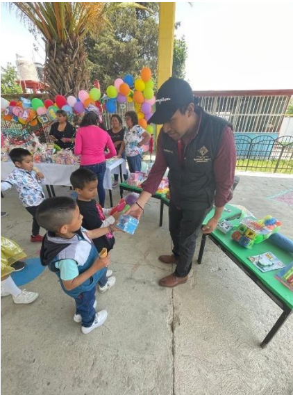
Entrega juguetes kínder de comunidad

Por último y no menos importante a lo largo de este informe he mencionado diversas actividades que se vinculan con otras comisiones y aunque no sea parte de comisiones como la del Deporte, he apoyado y gestionado material para ligas de futbol, mejora de espacios en comunidades como lo son los frontón canchas de futbol, la realización de labor social como faenas de limpieza en unidades deportivas, gestiones de apoyo para campañas de esterilización a mascotas, la gestión y donación de lentes a algunas personas de mi comunidad como lo es José María Morelos, donación de pintura para la iglesia, apoyos económicos a comités religiosos, comités de cabalgatas, apoyo en transporte para equipos de futbol, voleibol, basquetbol, de nivel secundaria de la misma comunidad, acompañamiento en cambios de luminaria, bacheo, apoyo económico y detalles pequeños para convivios y festejos, día de las madres, día del niño, día del adulto mayor, navidad, incluso gestiones de obra complemento de barda como la del jardín de niños de la misma comunidad, apoyo en mantenimiento e insumos de equipo de jardinería.