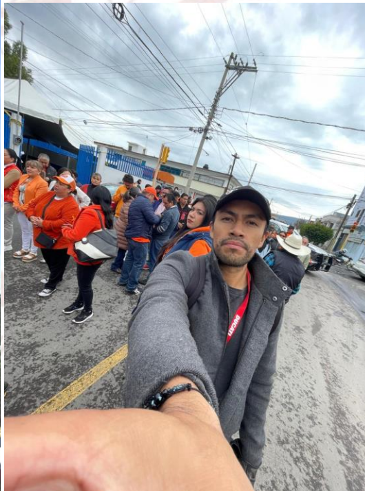
caminata dia naranja en cabecera mpa.