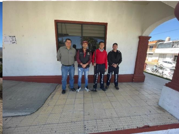
Donación de pala azadón a protección civil