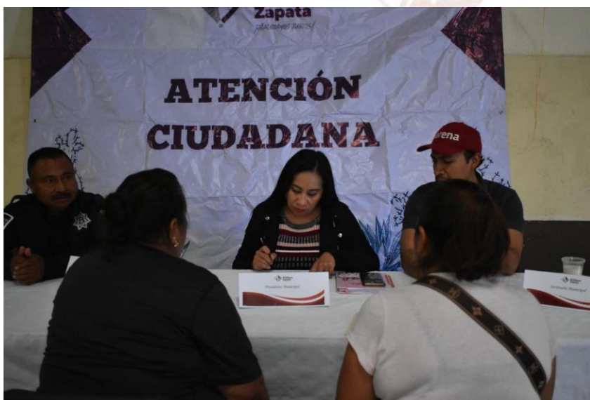
Atención ciudadana en comunidad 13 -nov-2024 presidenta y regidor

Su servidor y compañeros del ayuntamiento nos dimos a la tarea de realizar cortas evaluaciones a cada director y directora, coordinadora y coordinador del ayuntamiento para hacer observaciones a sus planes de trabajo, como lo son las “rutas del bienestar” que tienen por objetivo acercar todas las áreas del ayuntamiento a las comunidades lejanas a la cabecera municipal, evitando largas filas y trámites tardados, incluso dando respuesta rápida a algunas peticiones de la ciudadanía.