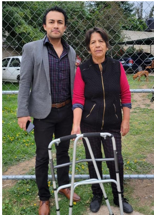
Entrega de andadera apoyo social

De igual manera otro objetivo del PMD como “Colaborar con la preservación de la seguridad ciudadana y la protección civil en el municipio, privilegiando la prevención y el respeto esencial de los derechos humanos”. He sido participe y colaborando con la seguridad ciudadana con campañas de promoción de denuncia ciudadana, actividades recreativas por parte de seguridad pública donde promueven la prevención del delito y respeto a los demás ciudadanos.