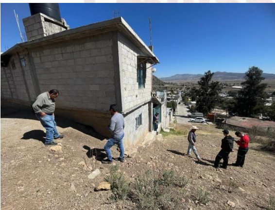
Inspección zona de riesgo - 11 abril-

Por otro lado la comisión de Protección Civil realizó 4 sesiones y mesas de trabajo de manera conjunta con el titular del área en su respectivo momento, ya que desde las herramientas y maquinaria de trabajo se fueron adquiriendo por donaciones, y hasta gestiones del propio director en turno. Hablando de los espacios de trabajo, dicha área tenía muchas deficiencias y carencias, por medio de su servidor con levantamiento fotográfico y apoyo en cabildo, hoy puedo decir que la comisión y de la mano de mis compañeros del ayuntamiento, vamos a poder ver a mediano plazo la mejora de espacio de esta dirección tan importante.