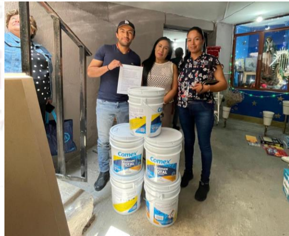
Entrega de pintura a delegada de comunidad.